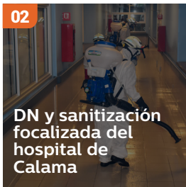
02 DN y sanitización focalizada del hospital de Calama