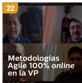
22 Metodologías Agile 100% online en la VP