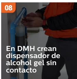
08 En DMH crean dispensador de alcohol gel sin contacto