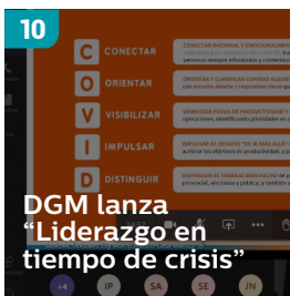
10 DGM lanza "Liderazgo en tiempo de crisis"