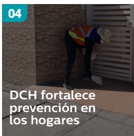
04 DCH fortalece prevención en los hogares