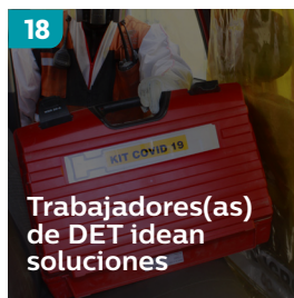
18 Trabajadores(as) de DET idean soluciones