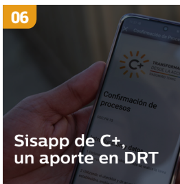
06 Sisapp de C+, un aporte en DRT