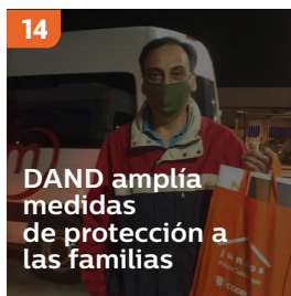
14 DAND amplía medidas de protección a las familias

Cada día llegan convencidos(as) de estar realizando una labor tan importante como riesgosa. Arriban de madrugada a la división, mucho antes que el resto. Se equipan de manera cuidadosa y con rigurosidad, pues no tienen espacio para el error. Una enfermera, un vigilante privado y un médico cuentan su experiencia y llaman al autocuidado. 16