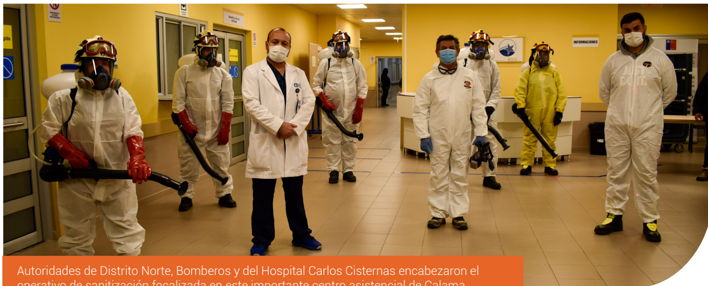
Autoridades de Distrito Norte, Bomberos y del Hospital Carlos Cisternas encabezaron el operativo de sanitización focalizada en este importante centro asistencial de Calama.

>> Nuevo foco de trabajo complementa la desinfección masiva de calles y la entrega de insumos sanitarios en diversas localidades de la Región de Antofagasta.