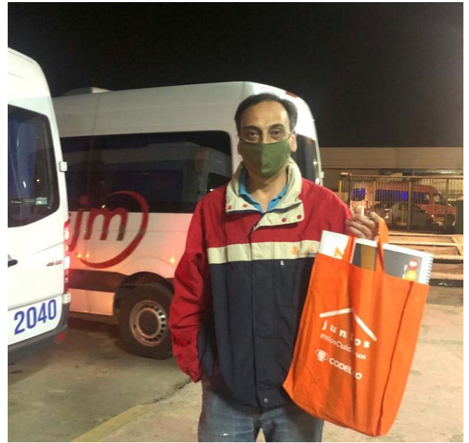
Los trabajadores(as) también recibieron información práctica sobre cómo protegerse en su casa, en el marco del plan de apoyo "Juntos nos cuidamos".

Todos los jueves entrevistamos a un profesional que nos aconseja sobre cómo convivir con el coronavirus en #CodelcoLive. Míralo aquí