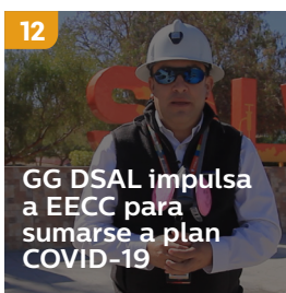
12 GG DSAL impulsa a EECC para sumarse a plan COVID-19