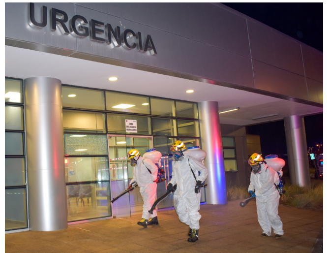
El área de urgencia, que tiene un alto tráfico de pacientes, fue una de las desinfectadas en el operativo.

Durante toda la semana se sanitizarán focalizadamente otros espacios, como los ocho centros de la salud primaria de Calama, la Teletón, el Centro de Detención Preventiva, el terminal agropecuario y el cementerio, entre otros.