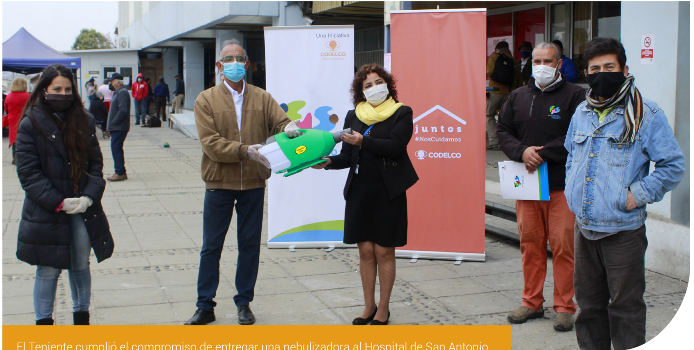
El Teniente cumplió el compromiso de entregar una nebulizadora al Hospital de San Antonio.

>> Olivar, Machalí, Coya, Doñihue, el Hospital Regional de Rancagua y el de San Antonio fueron los beneficiarios.