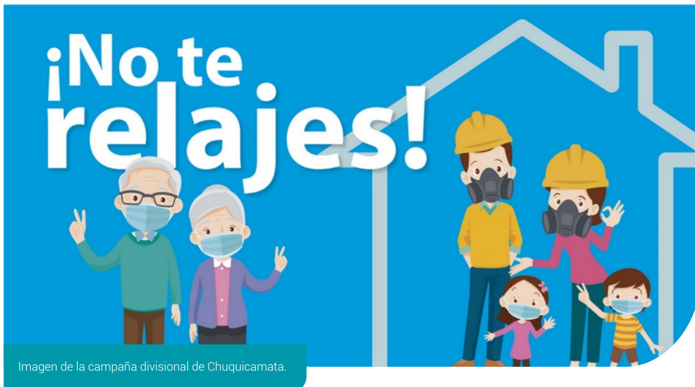
Imagen de la campaña divisional de Chuquicamata.

>> Repartimos en diferentes casas de Calama material informativo con las recomendaciones indicadas por la autoridad sanitaria, para resguardar la salud de las familias.