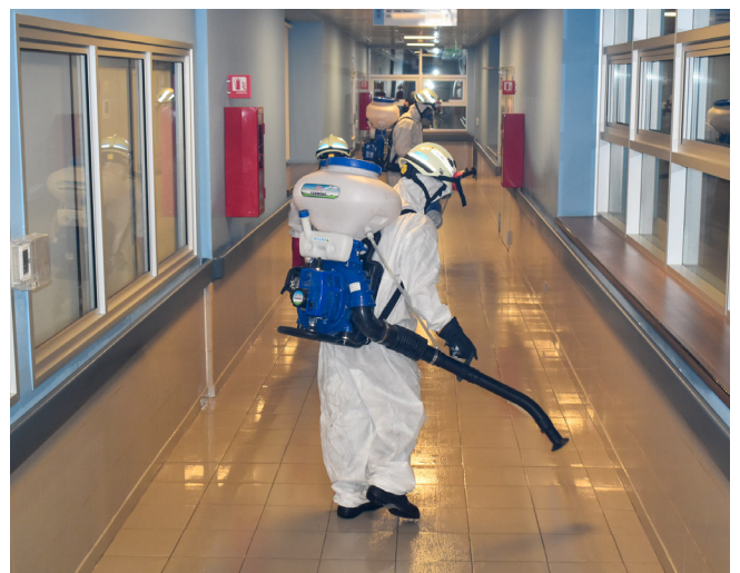
El Hospital Carlos Cisternas posee una superficie cercana a los 30 mil metros cuadrados y 1.200 funcionarios(as) trabajan en el recinto.

ESTA NUEVA INICIATIVA REFUERZA OTRAS ARISTAS DE LA CAMPAÑA, COMO EL APOORTE DE KITS SANITARIOS A DISTINTOS CENTROS DE SALUD DE LA REGIÓN, QUE SUMAN MÁS 25 MIL INSUMOS.